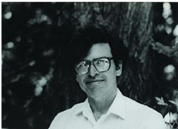
William Thurston (1946 – 2012)