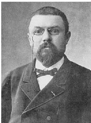
Henri Poincaré (1854—1912)